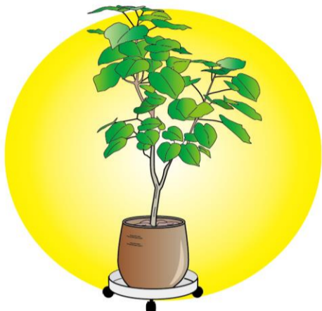
大きい観葉植物を移動させるのに、キャスター付きの鉢受けを使うと便利です。

印象的なアクセントにもなります。ただし、西日のあたる場所は、葉焼けなどの一因になるので、避けるのがベター。どうしても置きたい場合は、西日が当たる時間帯だけ少し移動させるか、レースのカーテンなどで日差しを避けることをおすすめします。