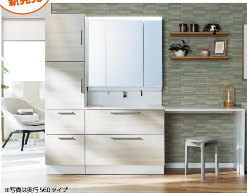
※写真は奥行560タイプ

新しい日常の暮らしに寄り添った洗面ドレッサーが誕生しました。モノをたっぷりしまえる奥行560タイプとコンパクトなサイズの奥行500タイプがあります。